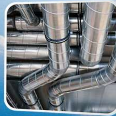
COMMERCIAL & INDUSTRIAL