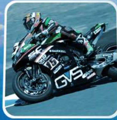
POWER SPORTS & OUTDOOR