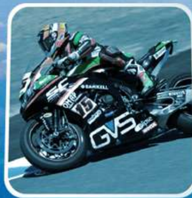
POWER SPORTS & OUTDOOR